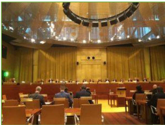
zitting 9 maart 2020

Alhoewel de Commissie deze inbreukprocedure al in oktober 2019 was gestart, is pas in januari 2020 aan het hof gevraagd om voorlopige voorzieningen (kort gezegd: bevroren activiteiten tuchtkamer). Een verzoek om voorlopige voorzieningen ( interim measures ) kan slechts worden toegewezen indien vaststaat dat die toewijzing zowel feitelijk als rechtens op het eerste gezicht gerechtvaardigd is ( fumus boni juris ). Ook moet er urgentie zijn in die zin dat alleen met de opschorting wordt voorkomen dat onherstelbare schade wordt toegebracht aan de belangen van verzoekster. De discussie rond die twee begrippen vormde dus de kern van de zitting van afgelopen maandag.