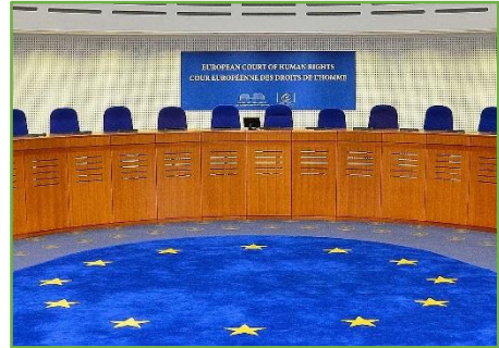
Europees Hof voor de Rechten van de Mens